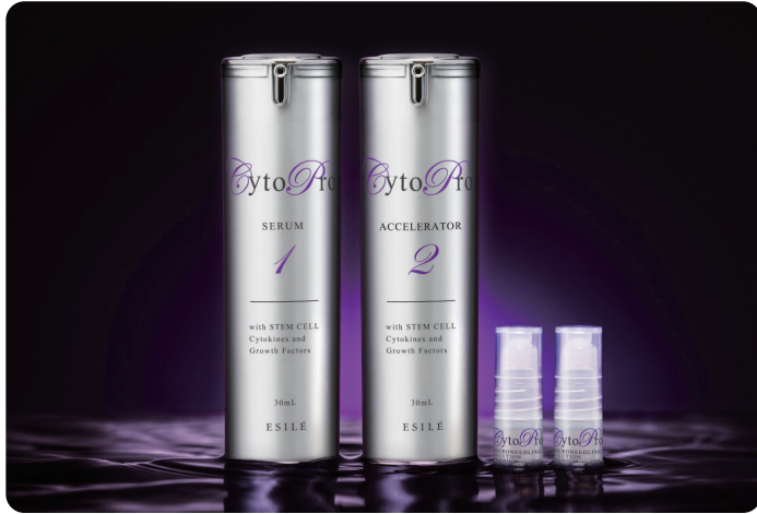
米国再生医療生まれのヒト骨髄幹細胞スキンケア 〈サイトプロ〉

多様な年代や肌質、時代のニーズにお応えする革新的な製品を取り扱っております。肌革命をもたらすスキンケア化粧品のほか、身体の中から美と健康を引き出すサプリメントもラインナップしています。