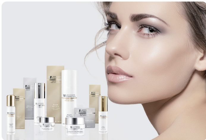
ドイツ発プロユーススキンケア 〈ヤンセン コスメティクス〉