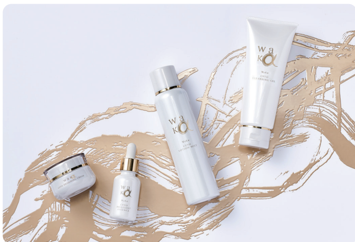
ヒト骨髄幹細胞×先端原料の国産スキンケア 〈ワカ〉