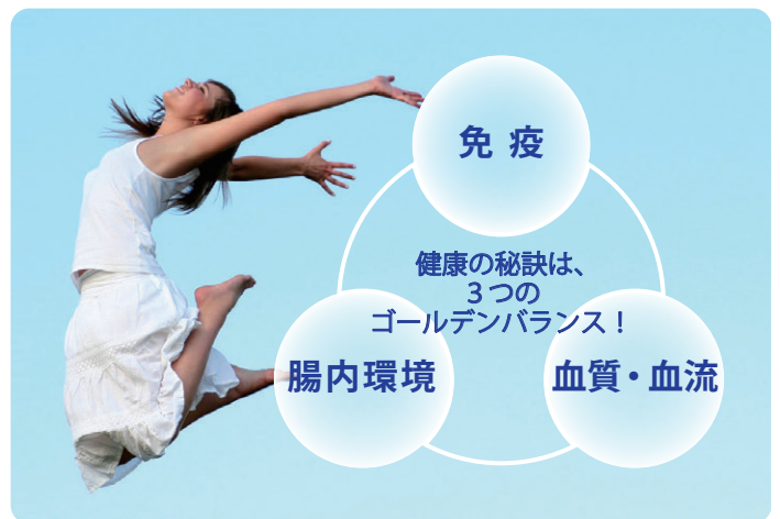
自然由来のエイジングケアサプリメント 〈ビー・ヘルシー〉